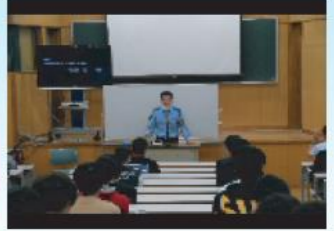
交通安全教室 (講義)