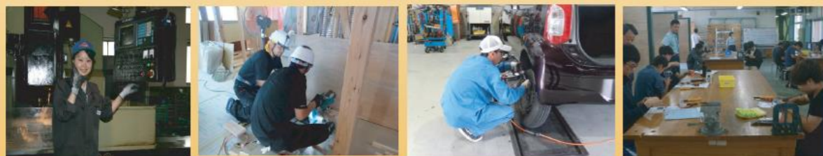
インターンシップに挑戦