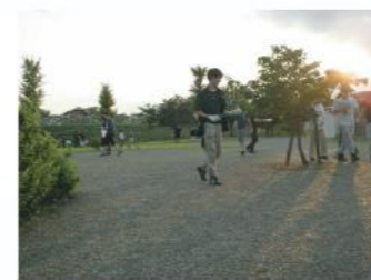
環境ボランティア活動