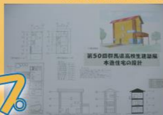
建築設計製図作品