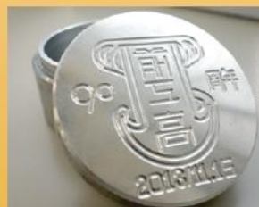
マシニングセンター作品