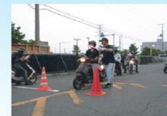
交通安全教室 (原付講習)